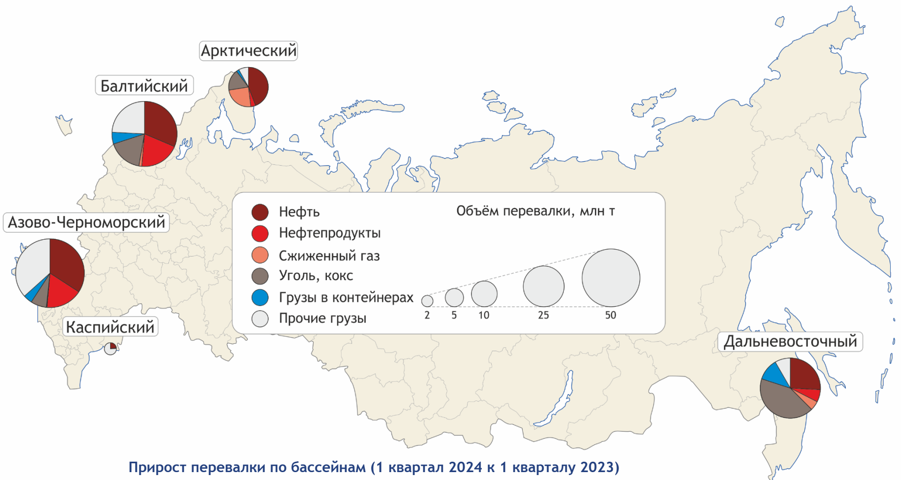
Прирост перевалки по бассейнам (1 квартал 2024 к 1 кварталу 2023)